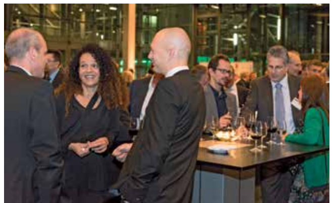
Gäste im Gespräch.